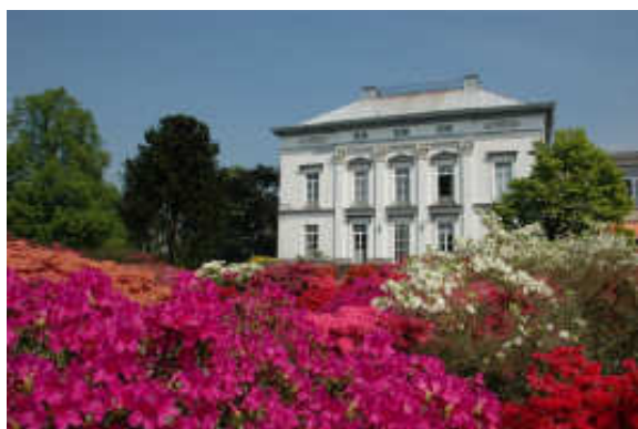
Tuinbouwschool Melle De groene school bij uitstek !